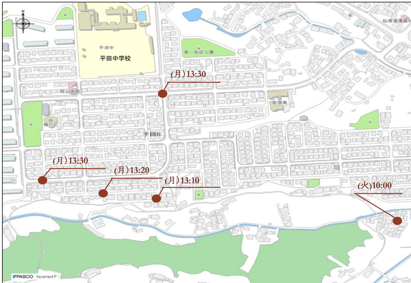
地図① トーヨド団地、梅が丘団地ほか